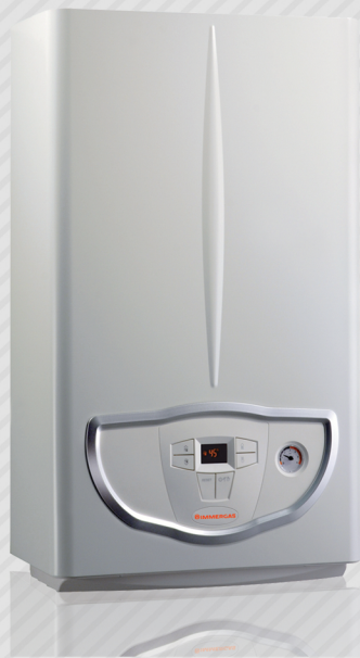
MINI EOLO PRO 28 KW

شرکت ایمرگس در سال ۱۹۶۴ در کشور ایتالیا (مهد سیستم های گرمایشی در سطح دنیا) با هدف فعالیت در حوزه سیستم های گرمایشی تاسیس گردیده است و در حال حاضر با ۵۵ سال فعالیت در حوزه سیستم های گرمایشی و با اتکا به ۱۱ مجموعه تولیدی خود در سطح دنیا، و همچنین با هدف دستیابی به کاهش حداکثری مصرف انرژی و رسیدن به حداقل آلاینده‌گی در سیستم های گرمایشی در کنار بخش تحقیق و توسعه فوق پیشرفته، به عنوان پیشرو در سیستم های گرمایشی و انرژی های نو مطرح بوده و دارای بزرگترین سهم بازار کشور ایتالیا میباشد